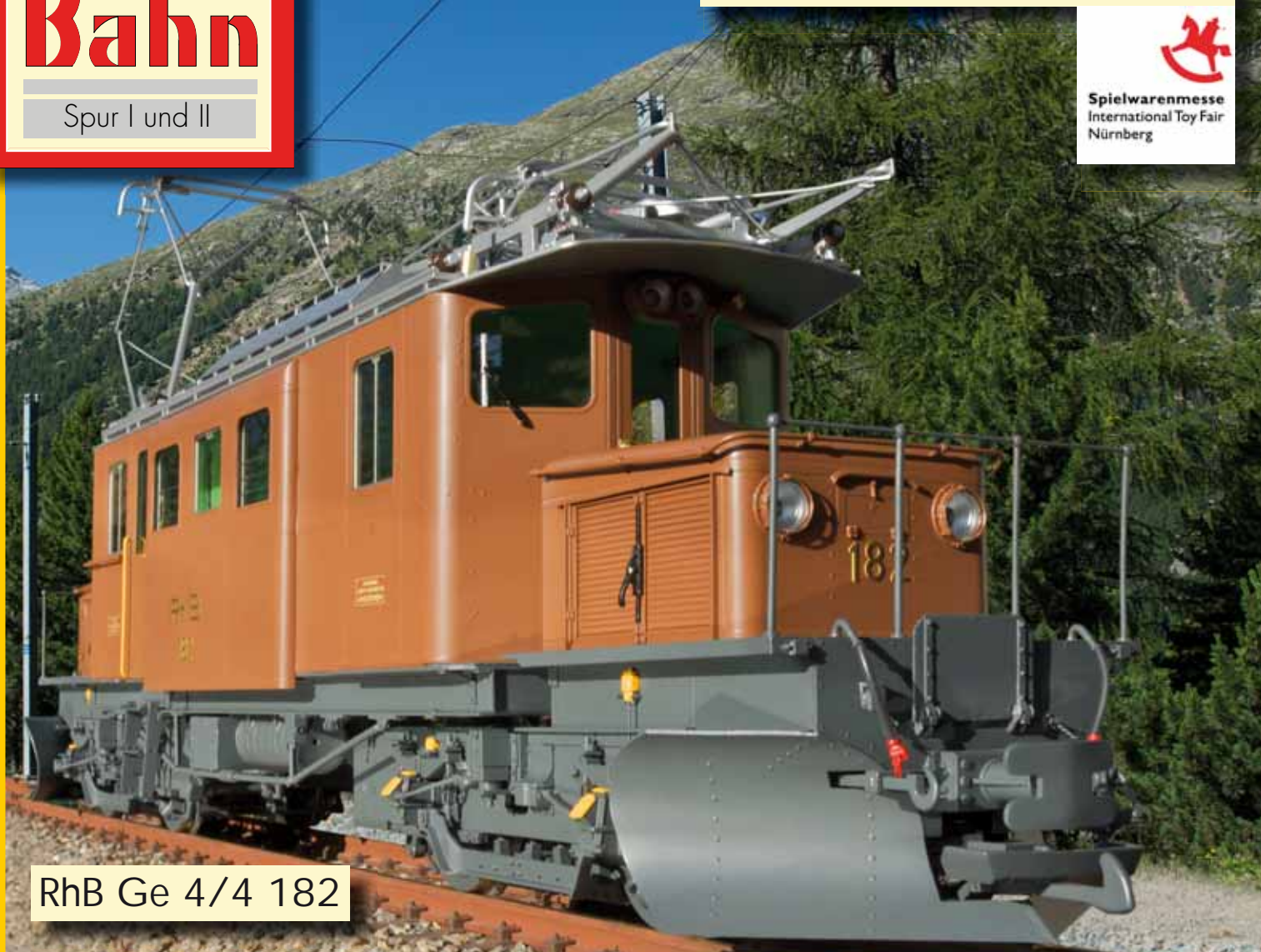
RhB Ge 4/4 182

Spielwarenmesse International Toy Fair Nürnberg