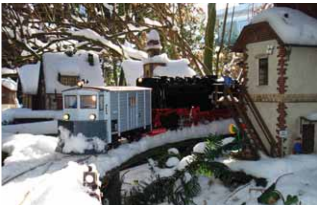
Modellbau: Winterfreuden. 38