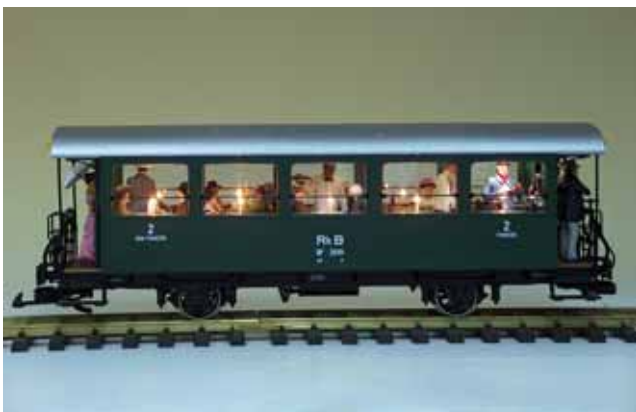
Modellbau: Umbau – vom Personenwagen zum Speisewagen. 42