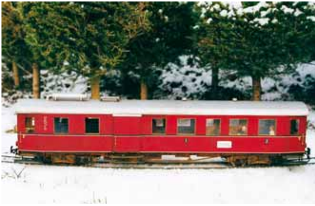
Vorbild & Modell: T 02 der Südhärzeisenbahn. 4