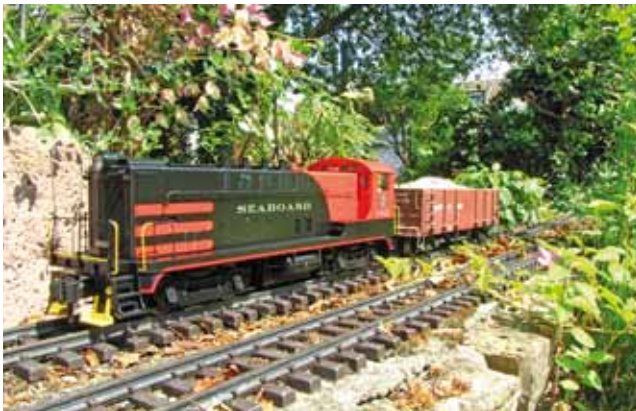
Modellbau: Diesellok V0-1000 von MTH-Railking. 26