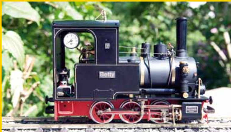
Modellbau: Lister Criter-Bausatz