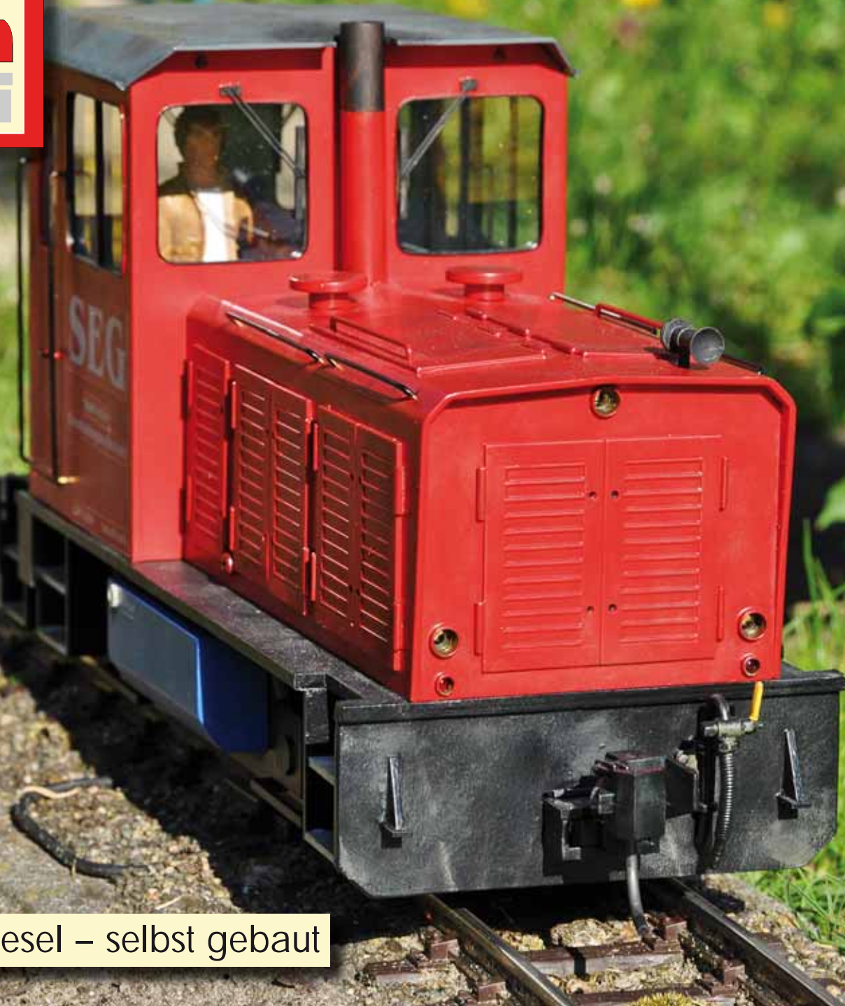
Borkum-Diesel – selbst gebaut