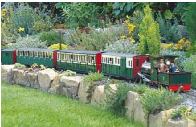
Anlagenporträt: Neubau einer englischen Gartenbahn. 32