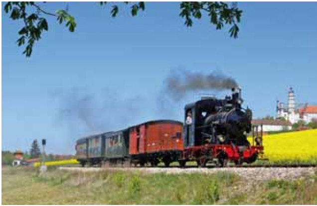
Vorbild: Muster-Museumsbahn feiert Jubiläum. 4