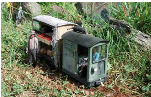
Gn15: Kanadische Kastenlok. 42