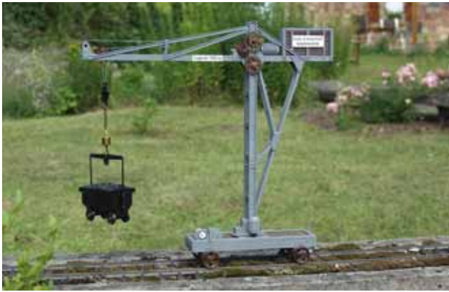
Modellbau: Selbstfahrender Schlackekran. 15