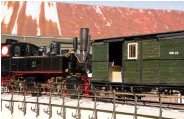
Modellbau: Tag des offenen Denkmals in Dischingen. 34

Titelbild: Dampflok HOYA auf der Anlage von P. Thonfeld.