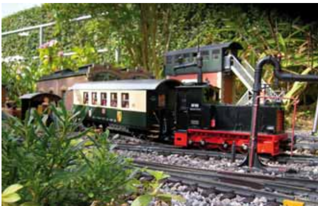
Modellbau: Salonwagen der Erzgebirgsbahn. 28