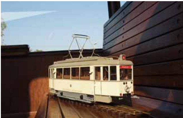
Modellbau: Straßenbahn-Bausatz. 24