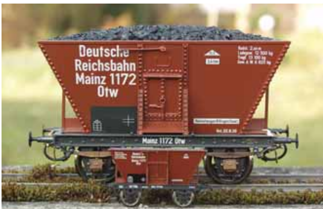
Modellbau: Kohlentrichterwagen. 48