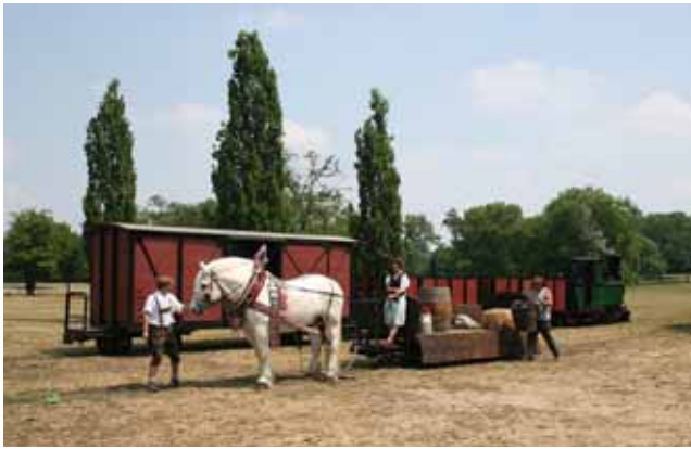
Vorbild: Landwirtschafts-Feldbahn. 4