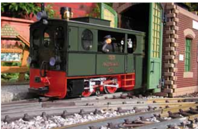
Modellbau: Sauerländer Kleinbahn. 14