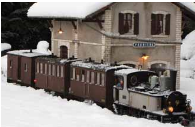
Anlagenporträt: Winterbetrieb. 10