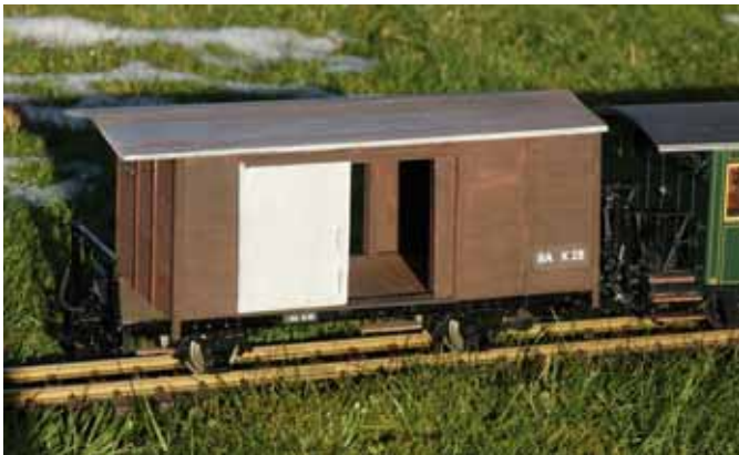
Güterwagen der früheren Biasca – Acquarossa Bahn. (Seite 10)