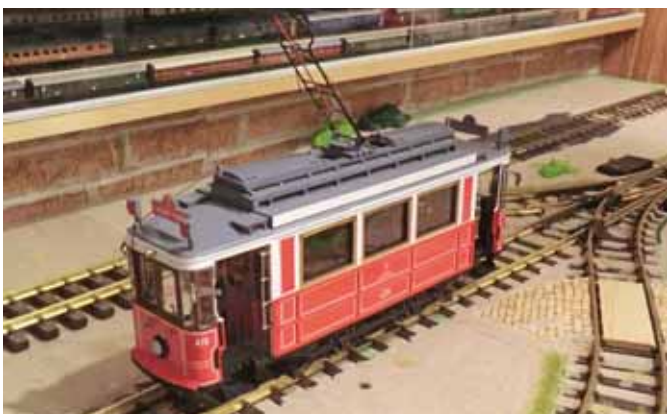
Oldtimer Straßenbahn vom Bosphorus. (Seite 17)