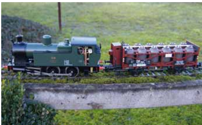
„Victory“ – Eine Werk- und Hafenlok. (Seite 34)

Titelbild: Auf der Anlage von Otto Hadorn