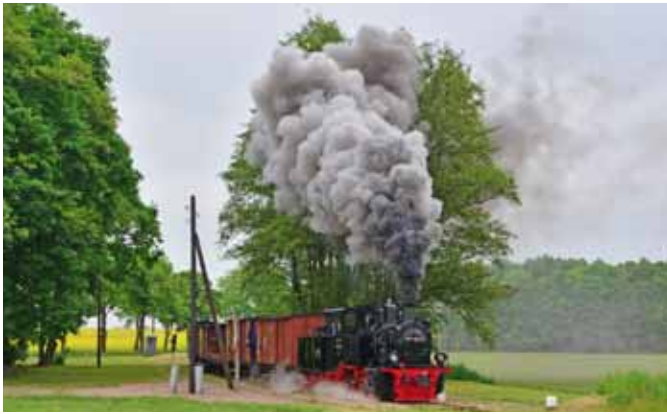
Beim „Pollo“. (Seite 4)